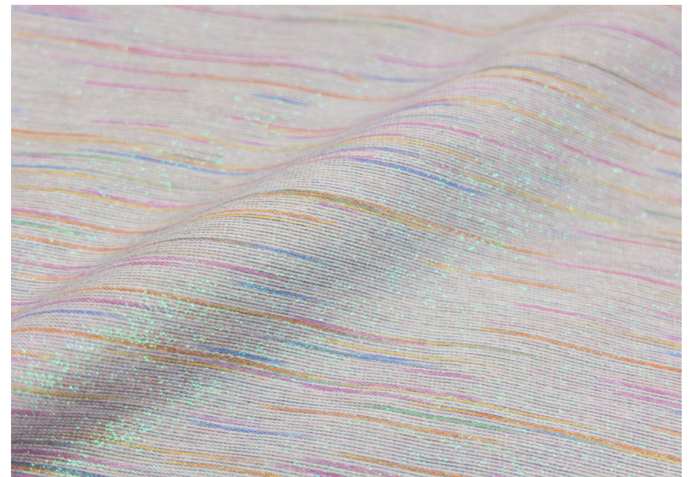
CANDY + DENIM grigio + IRIS eremo