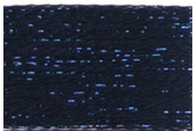
INSIGNA B25/ BLUETTE