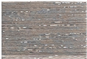
METALLO G150/ SILVER

Costruito con 1 Capo COTONE 30/1 tinto da NS. CARTELLA NATURALI + 1 Capo LAMÈ ORO/ ARGENTO o COLORATO + legatura NYLON GREGGIO