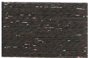
MILITARE G43/ GRAY