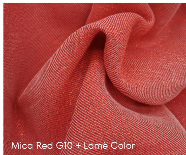
Mica Red G10 + Lamè Color