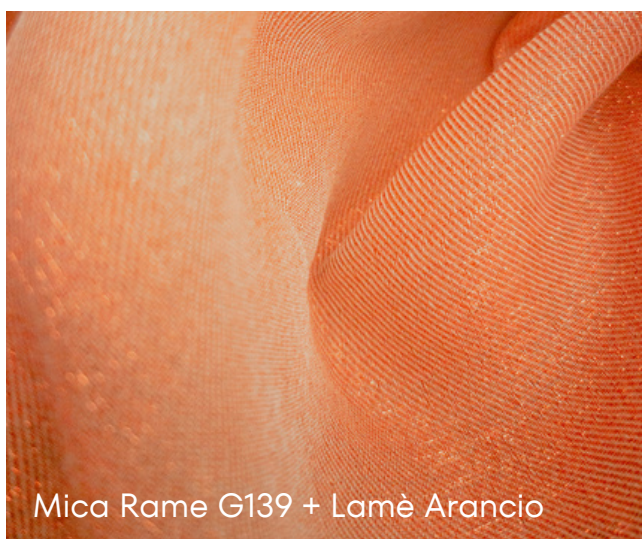
Mica Rame G139 + Lamè Arancio