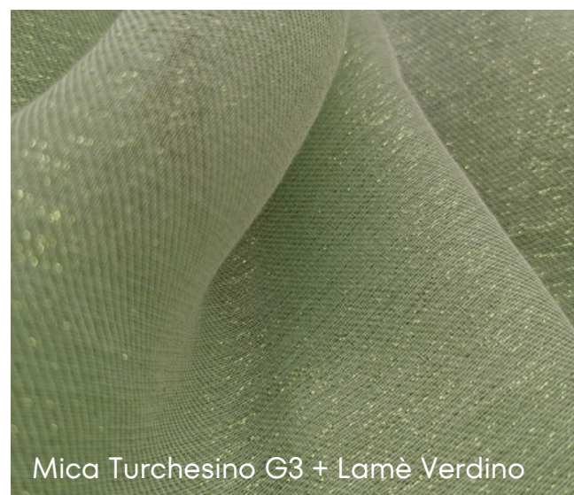
Mica Turchesino G3 + Lamè Verdino