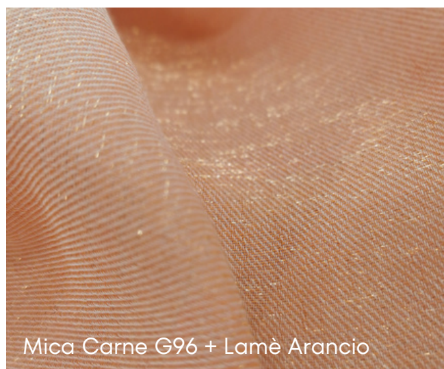
Mica Carne G96 + Lamè Arancio