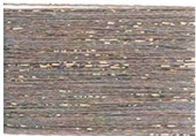
METALLO G150/ GOLD