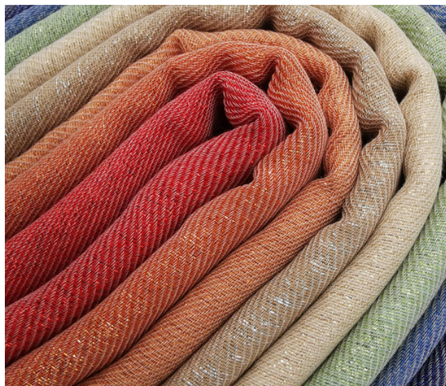
Mica Bluette G91 + Lamè Color