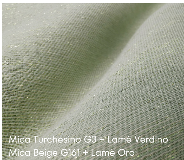
Mica Turchesino G3 + Lamè Verdino Mica Beige G161 + Lamè Oro