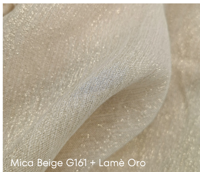
Mica Beige G161 + Lamè Oro