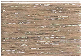
OLIVE GRAY 26/ SILVER