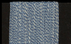
GG/BLEU S. 31/INDACO C. 49

FILATO 100% COTONE TITOLO FINALE NE 9/1 (NM 1/15000)